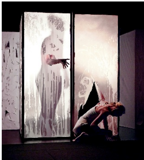
Sakte har har ei av jentene brote barrieren og kome seg fri.