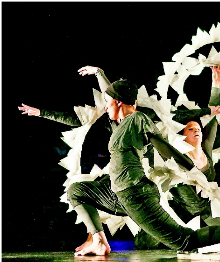
Leik og dans med eit stort mylder av papir.

Framsyninga var heilt avhengig av eit modellerande lys. Lysfolka frå ZLYD gjorde ein utmerka innsats.